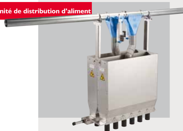
Unité de distribution d'aliment