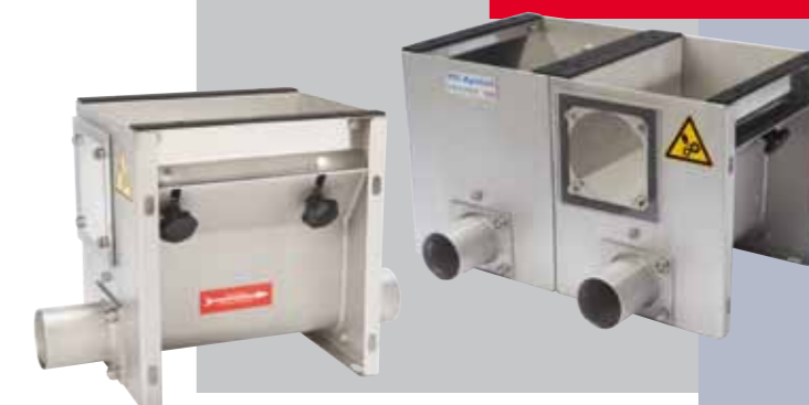
Trémie de réception en inox