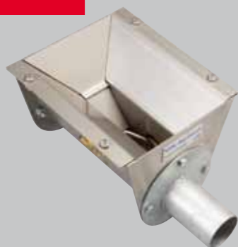
Boîtard réception retour